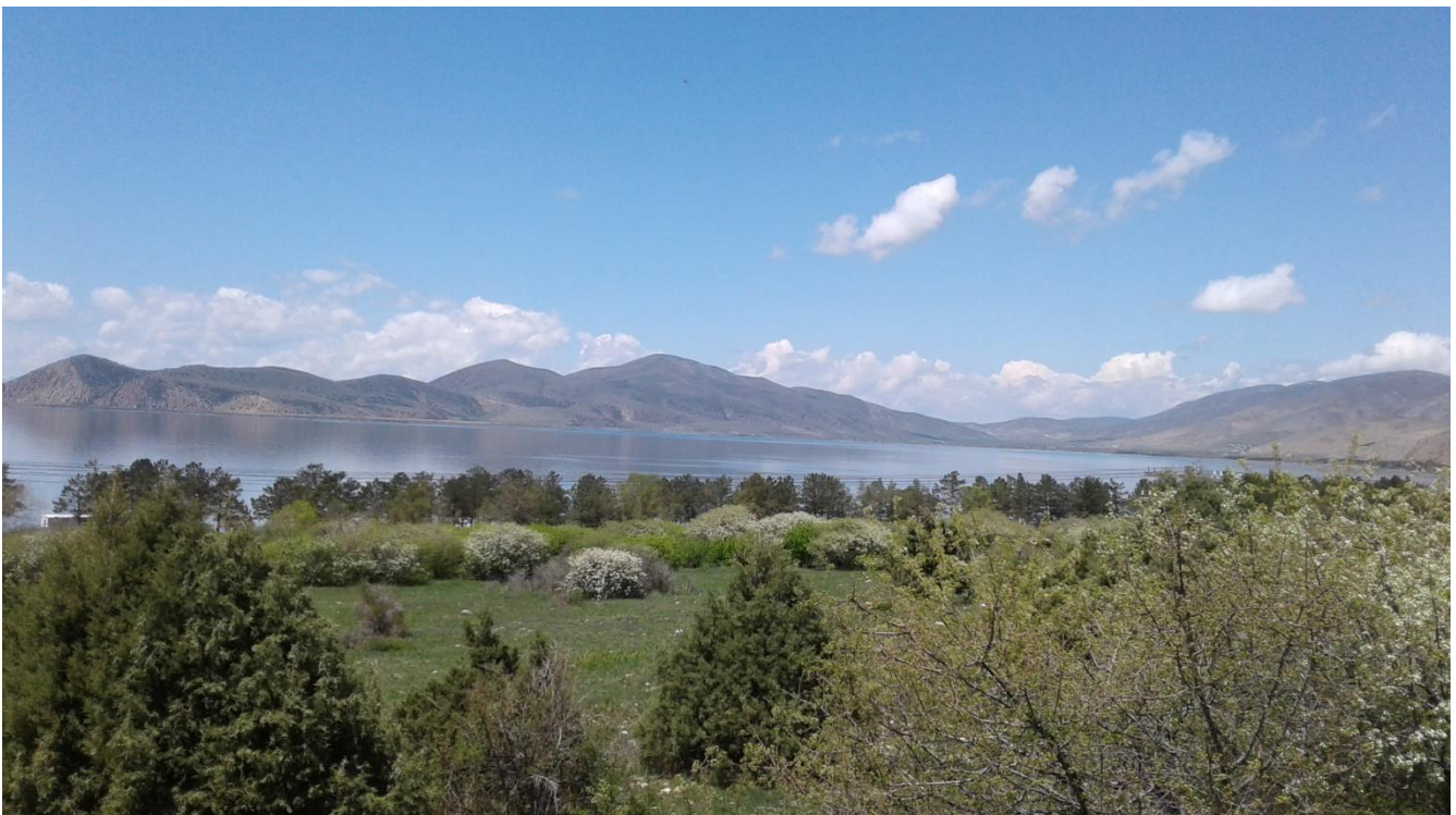
Նկար 1. Ափամերձ լանդշաֆտ. Մեծ Սևան