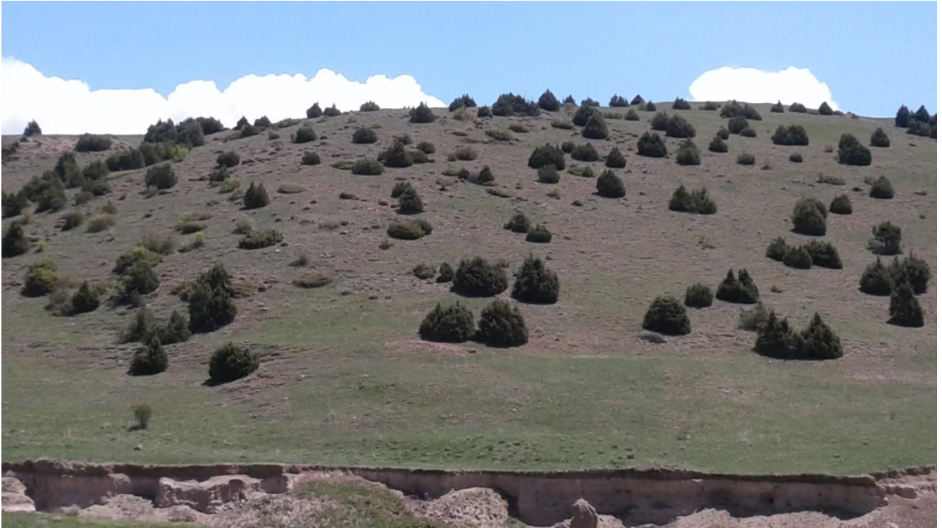
Նկար 2. Գիծուտ Սևանա լճի արևելյան ափին